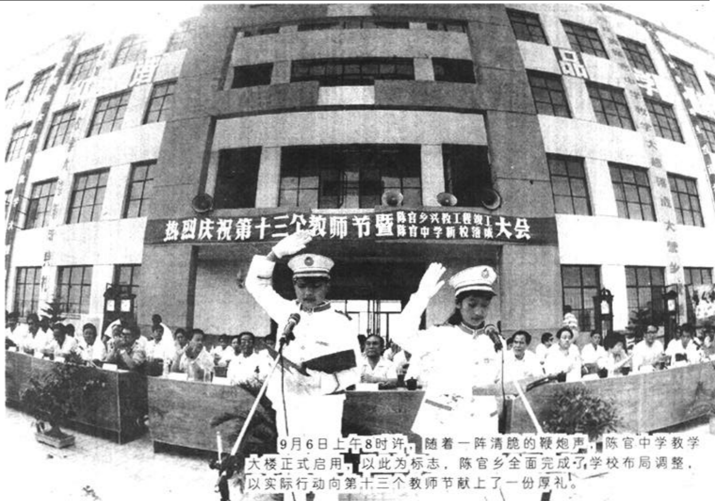
9月6日上午8时许，随着一阵清脆的鞭炮声，陈官中学教学大楼正式启用，以此为标志，陈官乡全面完成了学校布局调整，以实际行动向第十三个教师节献上了一份厚礼。

十几年来，他送走了近200名学生，他的学生有的早已高中毕业，大学毕业，可他的生活一点也没变。他就像蜡烛，燃烧着自己，照亮了别人；他又像小草，默默无闻，然而正是这些小草才绿化了大地。（本报记者）